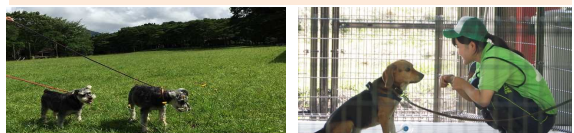
熊本地震ペット救援センター（平常時は九州災害時動物救援センター）における被災ペットの一時預かり