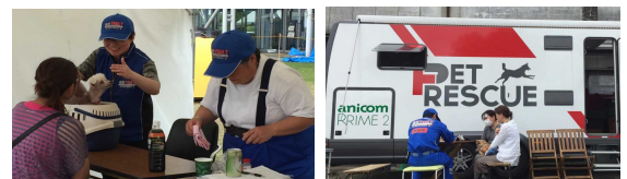
熊本地震における避難所での愛護動物救護活動(VMAT)