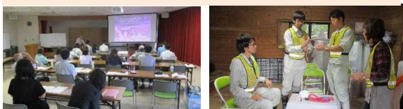
九州災害時動物救援センターにおける人材育成研修