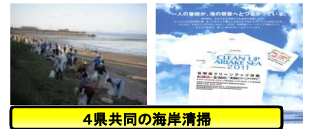
4県共同の海岸清掃