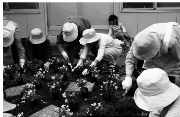
「ごみゼロ隊」による花いっぱい運動