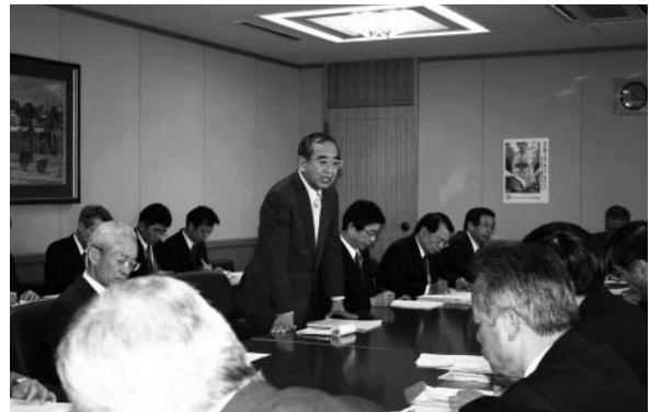
ごみゼロおおいた作戦実施本部

県は、『県民とともに築く「安心」「活力」「発展」の大分県』を基本目標に、大分県新長期総合計画「安心・活力・発展プラン2005 - とともに築こう大分の未来 -」を平成17年10月に策定した。この計画には、新たな地域間競争に打ち勝つために「選択と集中」の理念に従い、分野横断的に集中的・重点的に取り組む8つの重点戦略が掲げられており、ごみゼロおおいた作戦もその一つに位置づけられた。