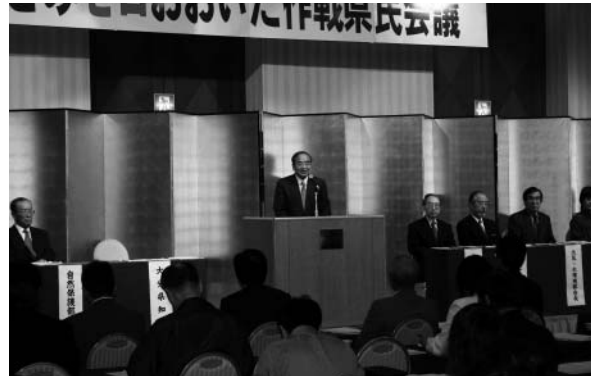
ごみゼロおおいた作戦県民会議

また、県庁内には、各部にまたがる環境行政全般を一体的・総合的に推進するため、知事を本部長とする「ごみゼロおおいた作戦実施本部」を設置し、県民会議と緊密に連携しながら各般の環境施策を推進している。