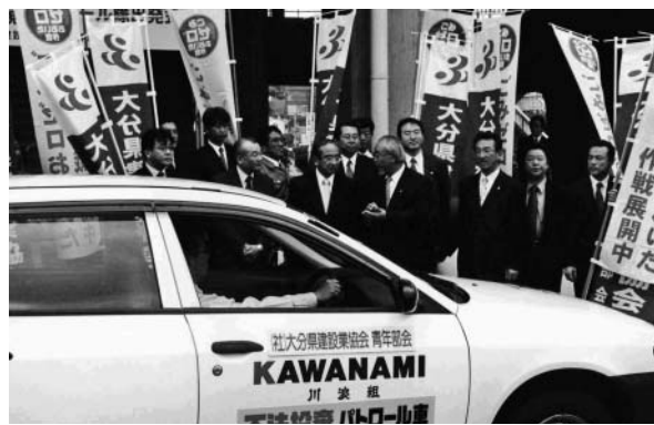
ごみゼロおおいた・不法投棄監視パトロール隊