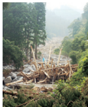
平成24年九州北部豪雨での土砂災害