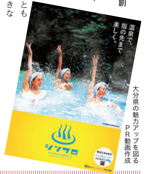
大分県の魅力アップを図るPR動画作成