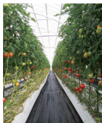
大規模園芸施設(トマト)