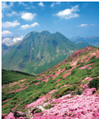
ミヤマキリシマとくじゅう連山

● また、生物多様性の保全、ユネスコエコパークの登録推進、世界農業遺産や日本ジオパークを活用した地域づくりにも取り組みます。