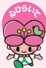
大分県人権啓発 イメージキャラクター こころちゃん

人は誰でもその人だけの力を持っています。輝いているところにもっと注目しませんか？三日月を見る時のように。