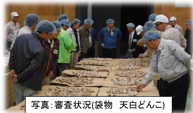
写真: 審査状況(袋物 天白どんこ)