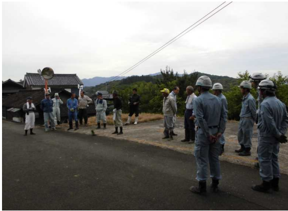
作業前のあいさつ、作業内容の確認