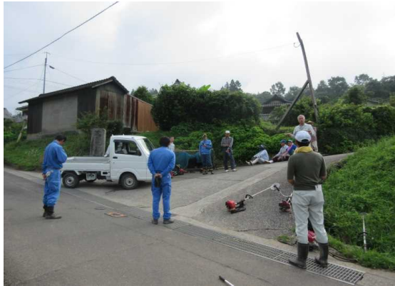
作業前のあいさつ、作業内容確認