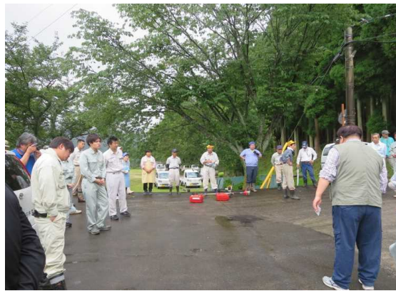
作業前のあいさつ、作業内容確認