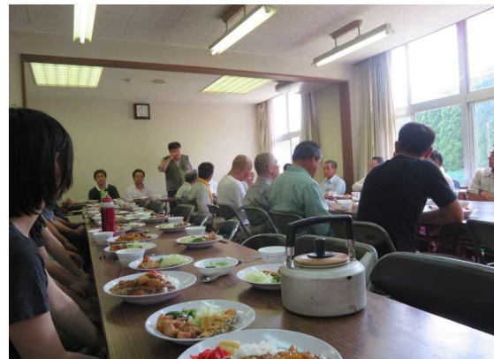
作業終了後の昼食会