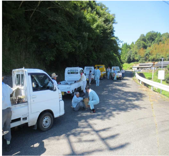
作業後、お茶等の提供