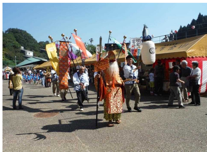
御輿行列への参加