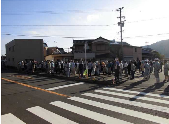
作業前のあいさつ、作業内容確認