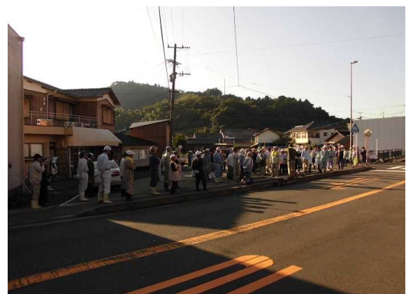
作業終了後のあいさつ