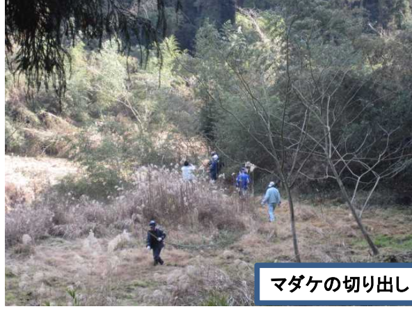
マダケの切り出し