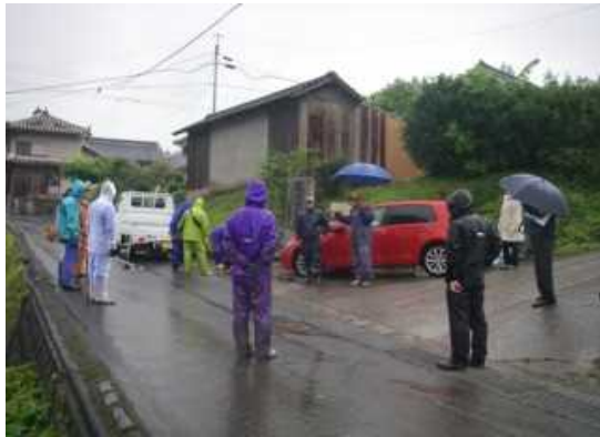
作業前のあいさつ、作業内容の確認