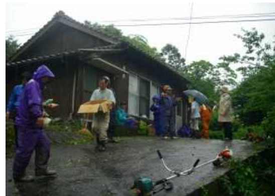
作業終了後、集落と応援隊の交流の様子