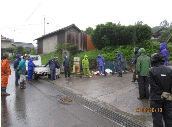
作業前のあいさつ、作業内容の確認