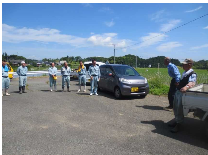
作業後、お礼のあいさつ