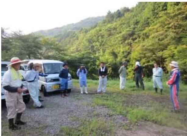
作業前、内容の説明