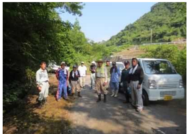
作業後、参加メンバーにて記念撮影