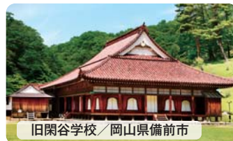
旧閑谷学校 / 岡山県備前市

地域の皆さんが大切に守ってきた遺産を多くの人に知ってもらい、地域の活性化につなげようと、県では、咸宜園跡などに続く日本遺産認定を目指しています。