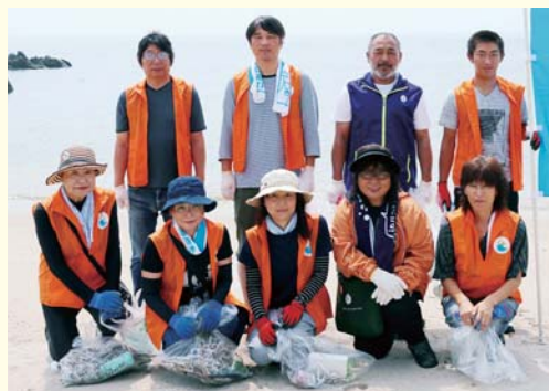
メンバーとボランティアの皆さん。前列右から2番目が海原副理事長、後列右端が鬼丸くん