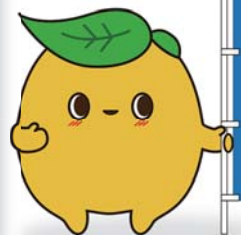
大分県環境教育 マスコットキャラクター「エコ助」