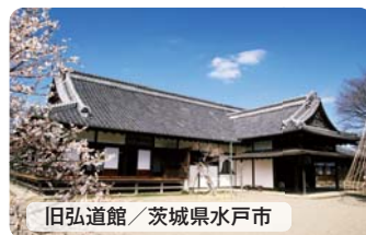
旧弘道館 / 茨城県水戸市