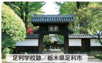
足利学校跡 / 栃木県足利市