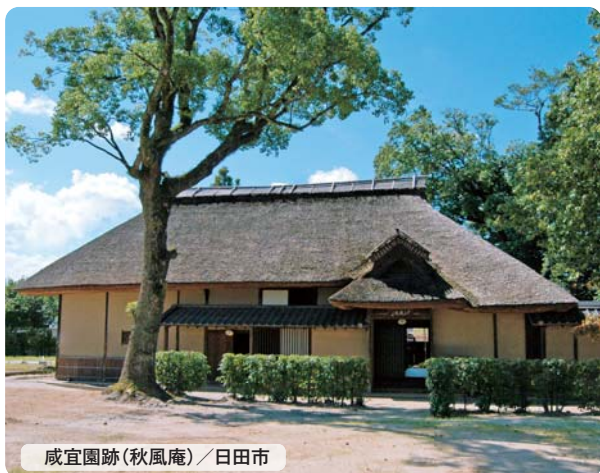
咸宜園跡 (秋風庵) / 日田市