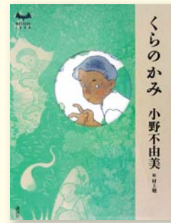
『くらのかみ』 小野不由美／著 講談社 2003年

小野不由美は中津市出身の小説家です。代表作である「悪霊シリーズ(ゴーストハントシリーズ)」や「十二国記シリーズ」は、発表から20年以上経った今でも多くの人に愛されています。また、2013年には『残穢』で山本周五郎賞を受賞しました。