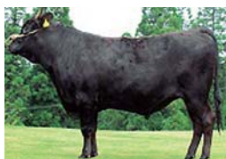
桜花国(さくらはなくに)