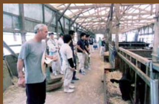
肉用牛ゼミナール

「今後は更に頭数を増やし、良い牛を作っていきたいですね。後継者仲間や同年代の友人たちと、色々な場面で地域に貢献できたらと思っています」