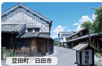
豆田町 / 日田市