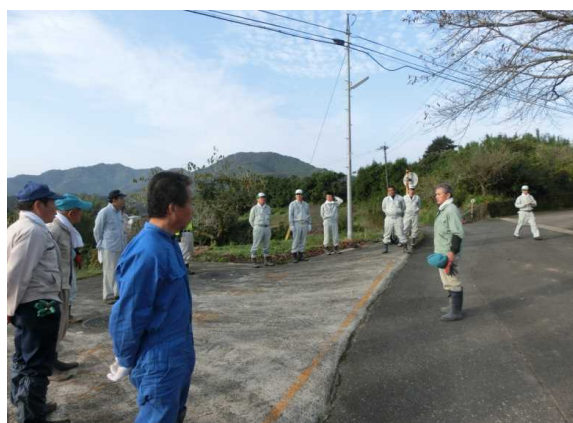
作業前のあいさつ、作業内容の確認