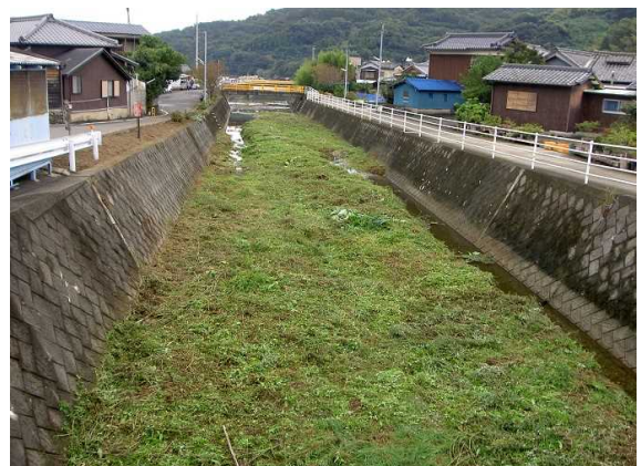
作業終了後のあいさつ