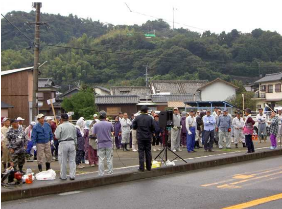
作業前のあいさつ、作業内容確認