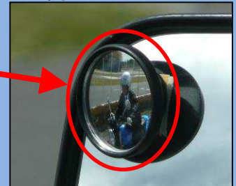
ほじよ しかく 補助ミラーでは死角にいる 自動二輪車を確認できる。