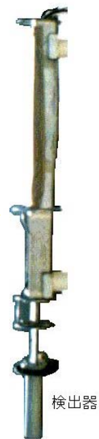
伊方1, 2号機放水口水モニタ設置状況