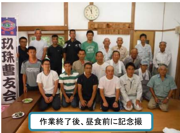
作業終了後、昼食前に記念撮