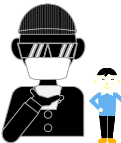
Bさんになりすましている犯人