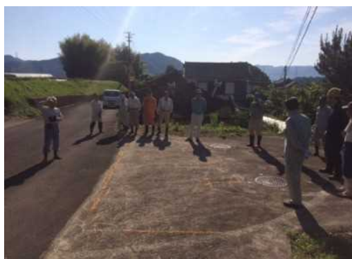
作業前のあいさつ、作業内容の確認