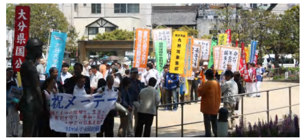
県労連メーデーデモ行進