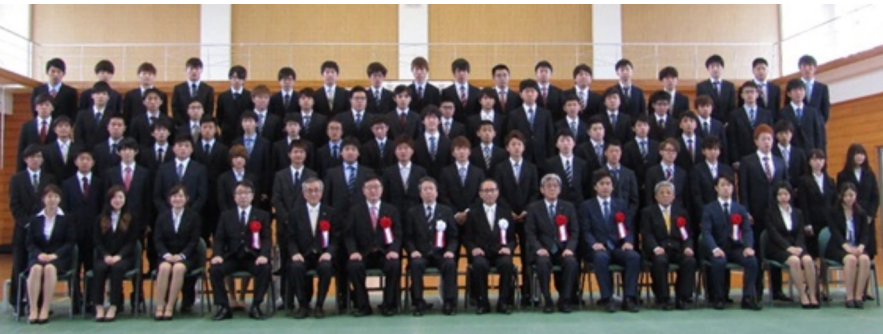
大分県立工科短期大学第20期生の皆さん

大分、佐伯、日田の各高等技術専門学校、別府の竹工芸訓練センターでも、4月11日(火)に平成29年度入校式が行われ、156名が入校し、それぞれ専門の職業人を目指し、新しいスタートをきりました。