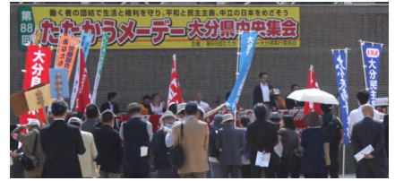
県労連メーデー中央集会会場

・安倍内閣の弱い者いじめの政治に対し昨年夏の参議院選での野党協力から広範な労働者の連帯をつくりだす必要がある。