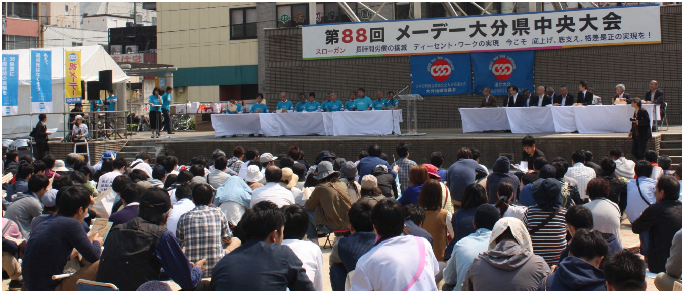
連合大分 第88回メーデー大分県中央大会の風景(大分市若草公園)