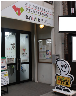
ジョブカフェおおいた本センター の入り口(大分市ガレリア竹町)