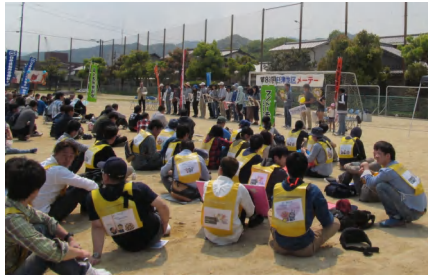
臼津地区メーデー会場