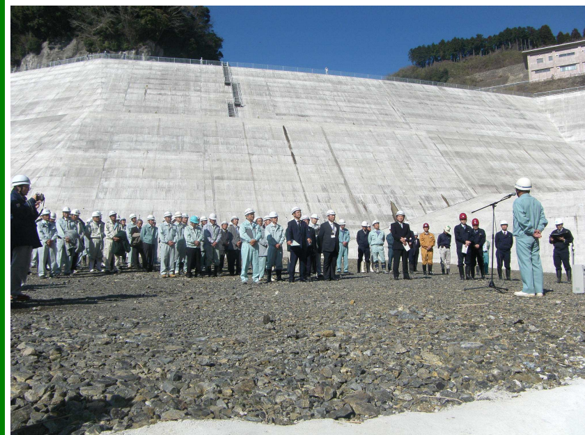
ゲート閉塞直後の様子

2月24日(水)雲ひとつ無い快晴のもと『湛水式』が行われ、関係者約70名が見守る中、堤内仮排水トンネルのゲートが閉められ、待ちに待った湛水が始まりました。