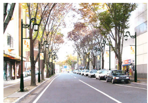
▲ 街路灯の整備（イメージ）