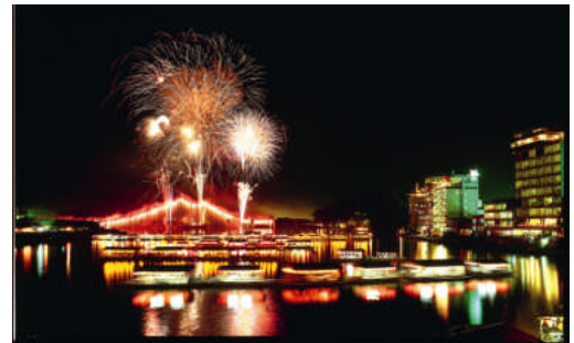
▲ 『水郷日田』三隈川が流れる隈地区