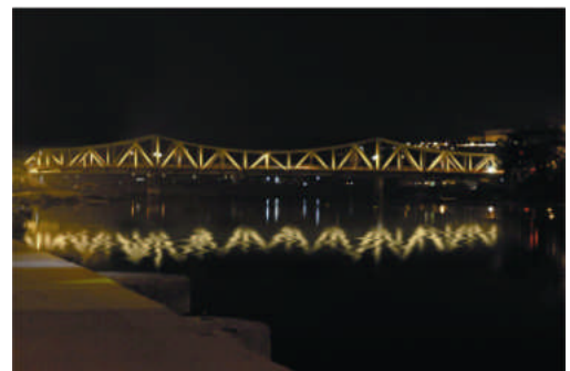
▲ 三隈大橋のライトアップ（イメージ）