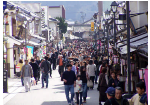
▲ 観光客で賑わう豆田地区

中心市街地の活性化に向け事業展開を行った、都市再生整備計画（日田市中心市街地地区）第 1 期計画の事後評価を踏まえ、残された課題と新たな課題を解決するため、庁内の関連部署や地元商店街、観光協会等と協議・検討を行い、第 2 期計画を策定した。