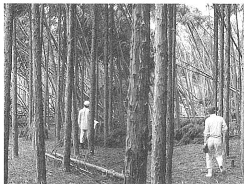
ナンゴウヒの植栽密度試験地の被害 (天瀬試験地)