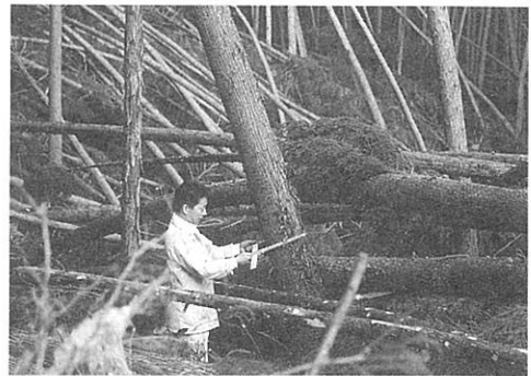
調査地の被害状況（天瀬町）