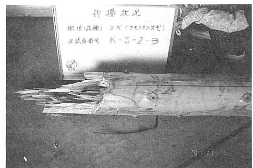
折損部付近のモメの状況