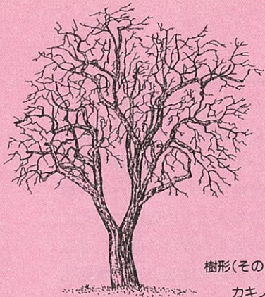
樹形(その8) カキノキ