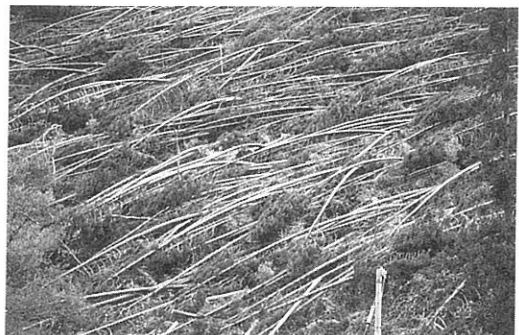
スギ倒伏型被害（天瀬町）