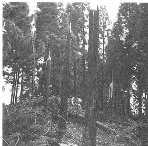
スギ見本園の被害(場内)