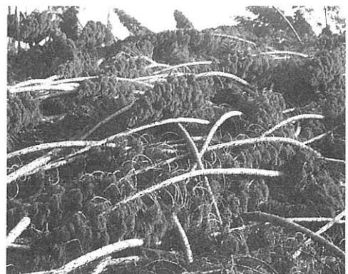
調査地の被害状況（玖珠町）