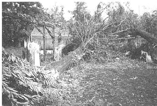
ガラス室に倒れたメタセコイヤ(場内)