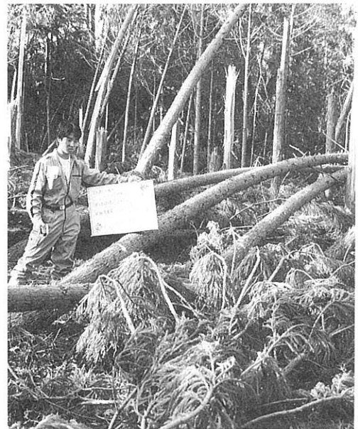
供試材の調査 (天瀬試験地)

注3 「曲げヤング係数」材が軸方向に力を受けた時、曲がりにくさを表す数値。曲げ破壊強度と相関があり、一般にこの数値が大きい材は、強度が大きい。