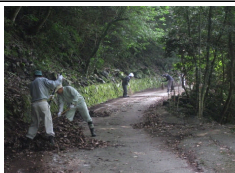
”久保ん谷湧水”までの道路等の草刈と清掃