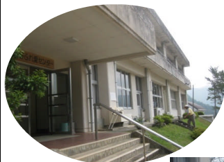
西神野ふれ愛センターとその周辺も清掃