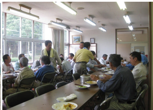
作業後に参加者みなさんで昼食