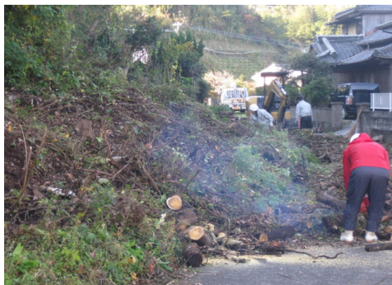
昨年の応援隊事業で伐採した雑木の撤去作業