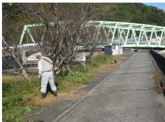
河川土手沿いの草刈