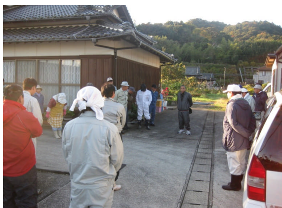
作業前、区長さんから挨拶