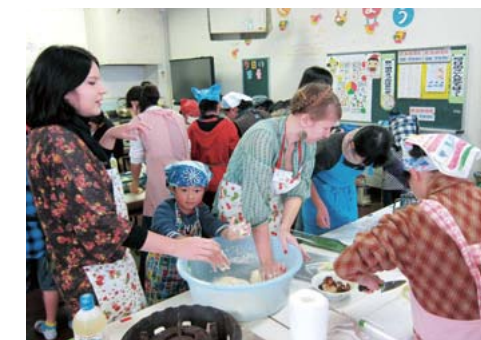
留学生と地域の交流（料理教室）