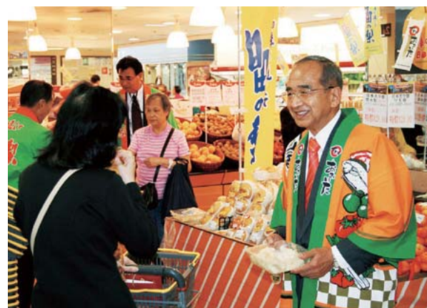
香港のスーパーでのトップセールス