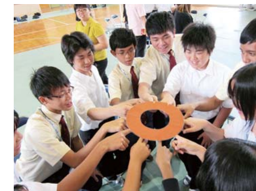
訪日教育旅行での外国(シンガポール)の生徒との交流