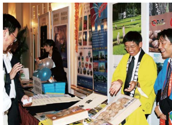
県産品等売り込む上海プロモーション