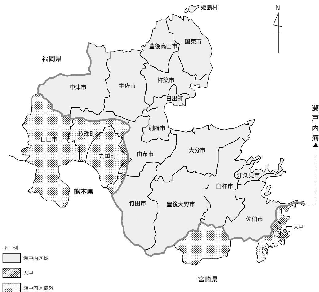
図 水質10 瀬戸内区域及び入津