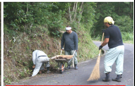
大森建設の皆さんは、お仕事に引き続いての作業でした。おつかれさまでした。