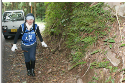
青いユニフォーム姿で作業に取り組む、