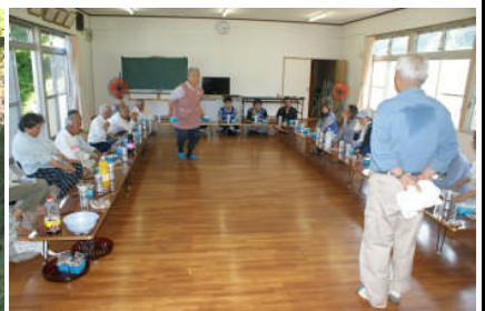
作業後に、住民の皆さんと交流会です。お豆腐とてんぷらをいただきました。