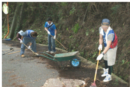
側溝の土砂上げは大変重労働です。