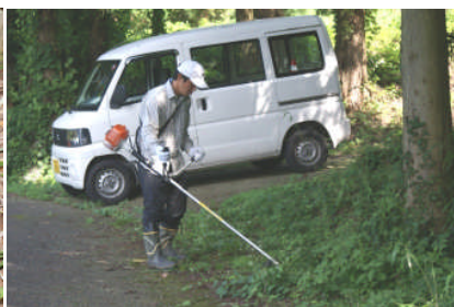
県東部振興局からも応援隊参加です。