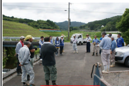
作業前のあいさつ