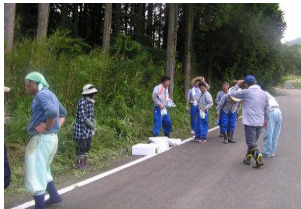
作業終了後の挨拶