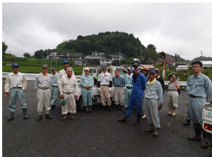
閉会（自治委員よりお礼の言葉と記念写真）