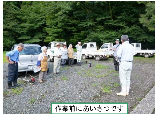
作業前にあいさつです