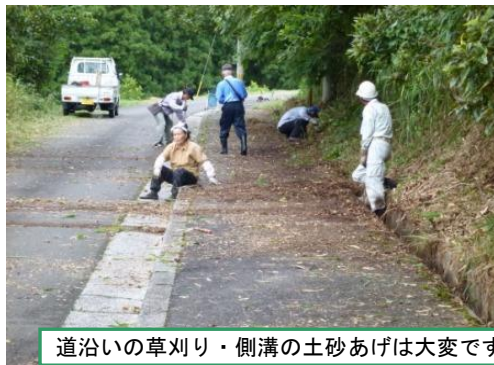
道沿いの草刈り・側溝の土砂あげは大変です