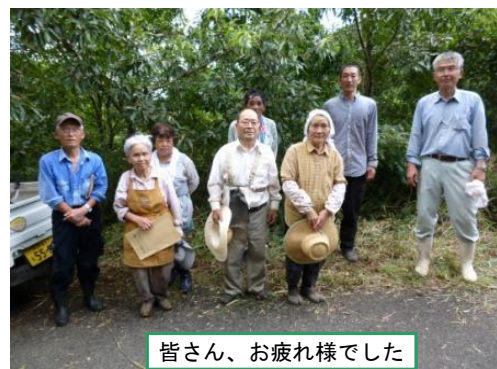
皆さん、お疲れ様でした