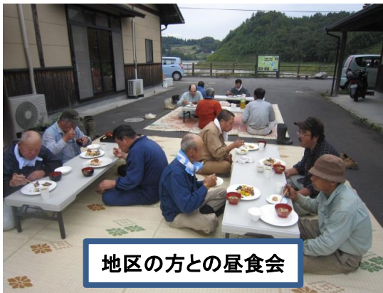
地区の方との昼食会