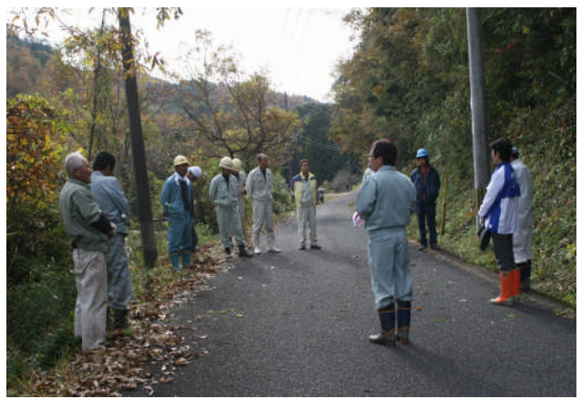
作業終了後の挨拶