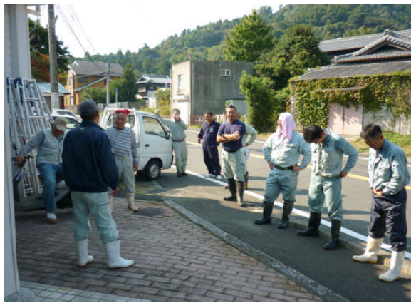
作業前、区長さんから作業内容の説明