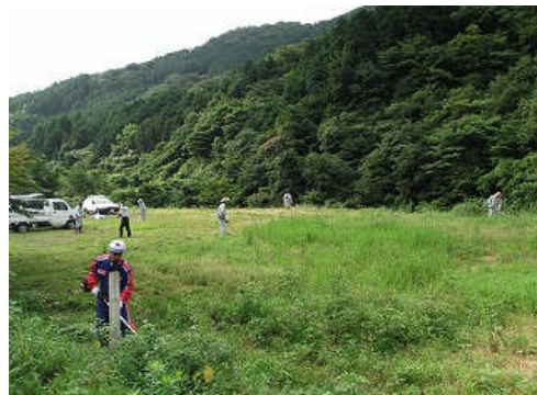
鹿嵐山登山駐車場