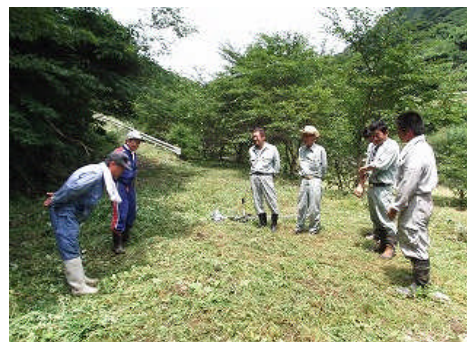
閉会式（自治委員よりお礼のことば）