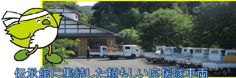
伝承館に集結した頼もしい応援隊車両