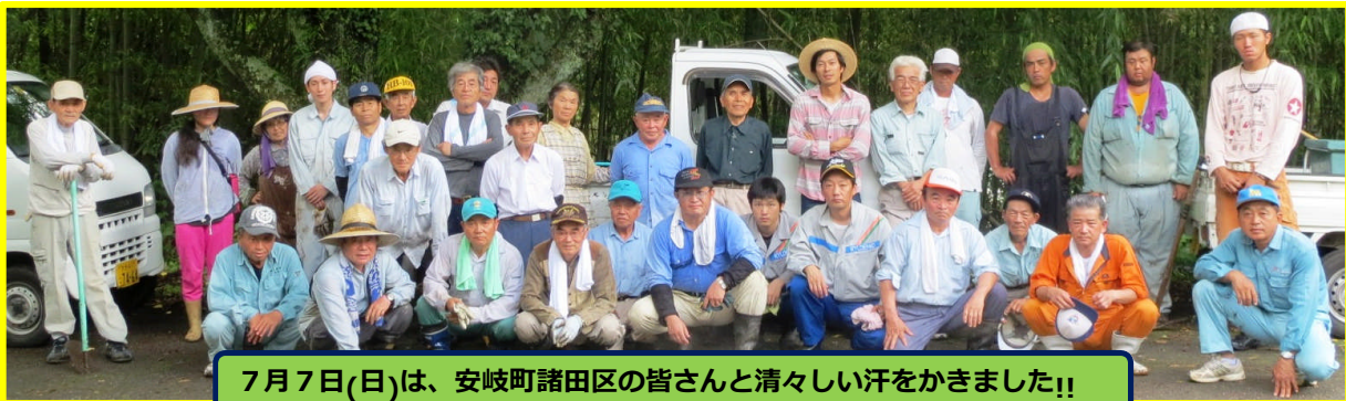
7月7日(日)は、安岐町諸田区の皆さんと清々しい汗をかきました!!