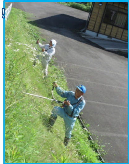
危険な斜面の草刈りは応援隊にお任せあれ！