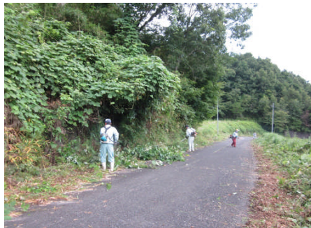
下村建設、深見地区まちづくり協議会の応援隊による草刈り作業