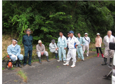
地元を代表して深見地区まちづくり協議会長より応援隊へ歓迎、お礼のことは