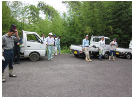
地元自治委員による応援隊へのお礼のことは