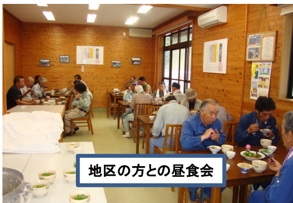
地区の方との昼食会