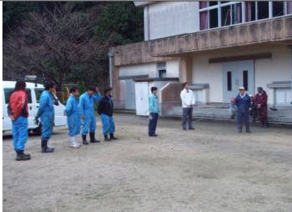
地元より応援隊の紹介