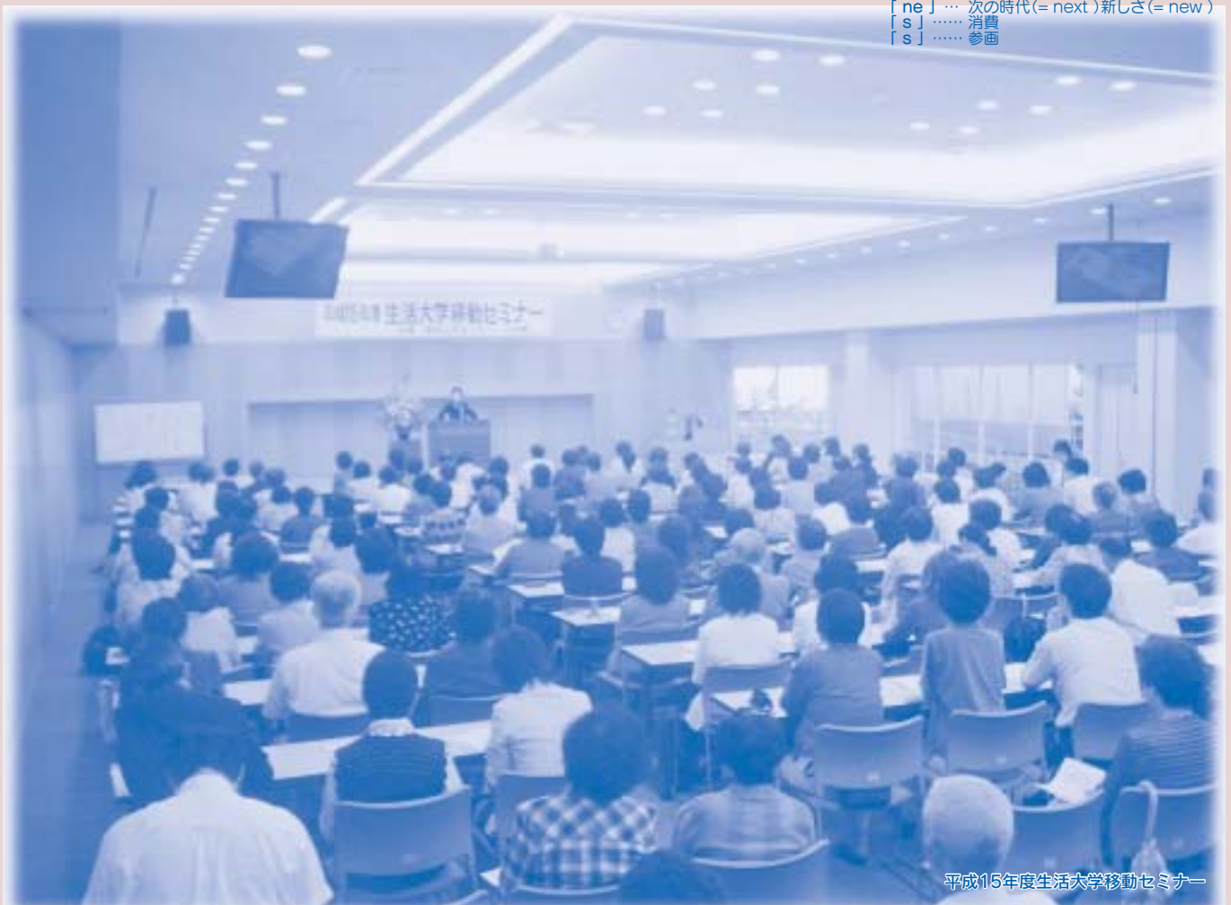
平成15年度生活大学移動セミナー

愛称…アイネス (i-ness) : 新しい時代の消費生活、男女共同参画を 自らが考える場を意味しています。 [ i ] …… 愛情・情報・私 [ ne ] …… 次の時代 (= next) 新しさ (= new) [ s ] …… 消費 [ s ] …… 参画