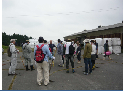
終了後、集落から感謝の言葉