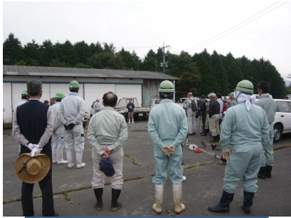
集落代表挨拶/作業説明