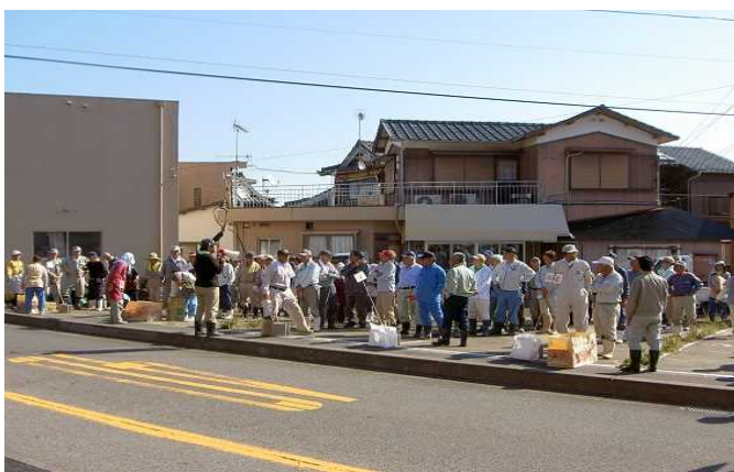
作業前、区長さんから作業内容の説明