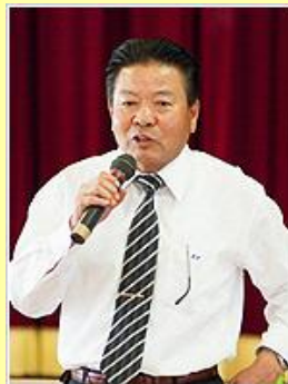
※第36回日田市青少年健全育成大会 「特別講演」合同事業（10:00開会）