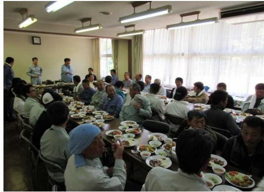
作業終了後の昼食会