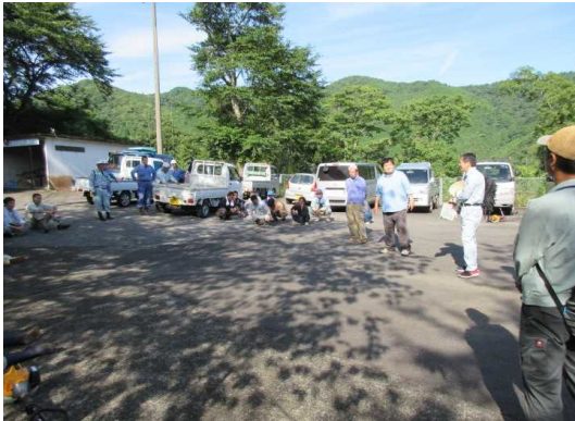
作業前のあいさつ、作業内容確認