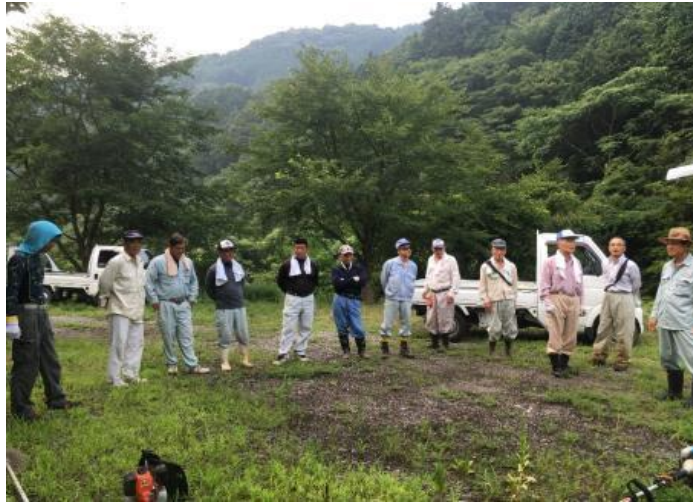
作業前、内容の説明