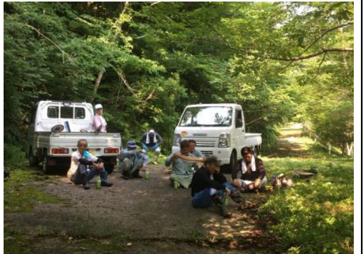
作業の合間に休憩する集落員と応援隊